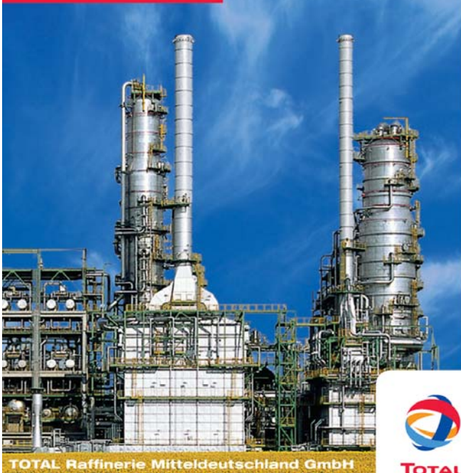
TOTAL Raffinerie Mitteldeutschland GmbH

TOTAL Raffinerie Mitteldeutschland GmbH Malenweg 1 06237 Spergau Telefon: (03461) 48-0 www.total.de